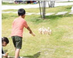
フィンランド生まれの “モルック”