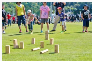
スウェーデン生まれの “クップ”